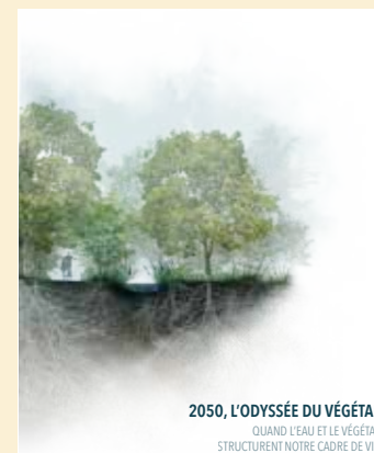
2050, L'ODYSSÉE DU VÉGÉTAL QUAND L'EAU ET LE VÉGÉTAL STRUCTURENT NOTRE CADRE DE VIE

Dans le contexte de changement climatique actuel, comment intégrer les concepts de transition écologique dans notre façon de penser, de construire et de vivre ensemble la ville de demain ? L'usage de l'eau et du végétal comme éléments structurants de nos paysages urbains prend tout son sens pour préserver les ressources naturelles, limiter les îlots de chaleur et lutter contre la baisse de la biodiversité.