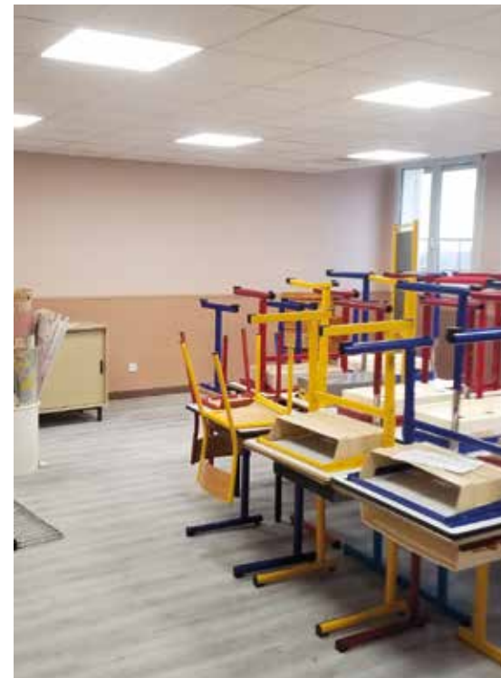
Salle de classe rénovée à G.Edme

C'est un engagement important de la ville avec près de 5 millions d'euros. Cela concerne 10 bâtiments scolaires et le gymnase de l'Espérance. Nous avons obtenu des subventions de l'Europe, de l'État et de la Région Bourgogne-Franche-Comté.