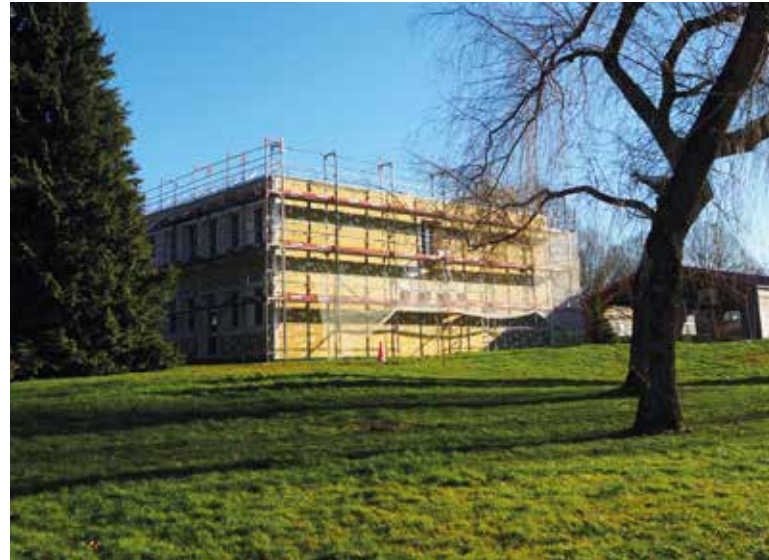
Réfection de la façade de l'école Sur les Vignes

Aujourd'hui, avec l'appui des plans de relance national et régional, nous pouvons accélérer les rénovations. Alors nous le faisons, car notre planète ne peut plus attendre.