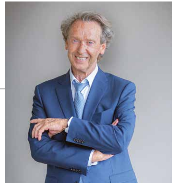
Martial Bourquin

La sécurité : nous tenons à ce que la tranquillité et la sécurité soient des droits à part entière. Ils sont remis en cause sans cesse par des jeunes et des moins jeunes qui multiplient des trafics, des rodéos, des nuisances et des troubles à l'ordre public. Cette situation est intolérable et nous comprenons l'exaspération de la majorité des familles face à ces comportements inadmissibles. Nous avons veillé, avec la police et la justice, à ce que les auteurs de troubles soient arrêtés et jugés. Des peines sévères ont été