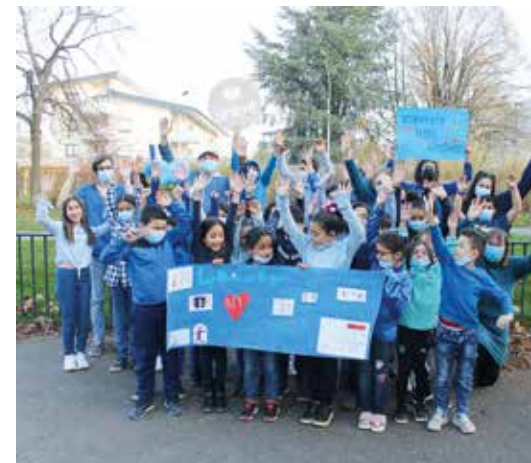
75 ans de l'UNICEF

> Les Francas – 60 avenue du 8 mai – 06 43 83 04 75