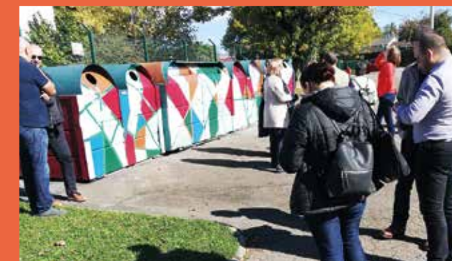
Diagnostic en marchant sur le quartier

- Le passage à un éclairage public en Leds améliorera le cadre de vie du quartier.