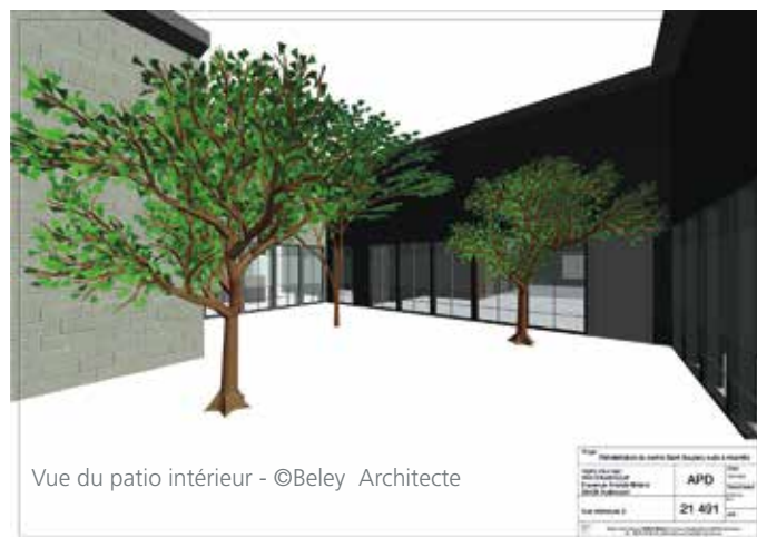
Vue du patio intérieur - ©Beley Architecte

Il faut qu'il redevienne le centre névralgique du quartier, qu'il soit le lieu qui impulse la vie, qui permette le renouveau des grandes fêtes de quartier que nous aimons tant, qu'il permette aux jeunes et aux moins jeunes de se retrouver, pour des cours de cuisine, de sports, pour des activités éducatives ou culturelles. Un lieu de création de vie et d'envie !