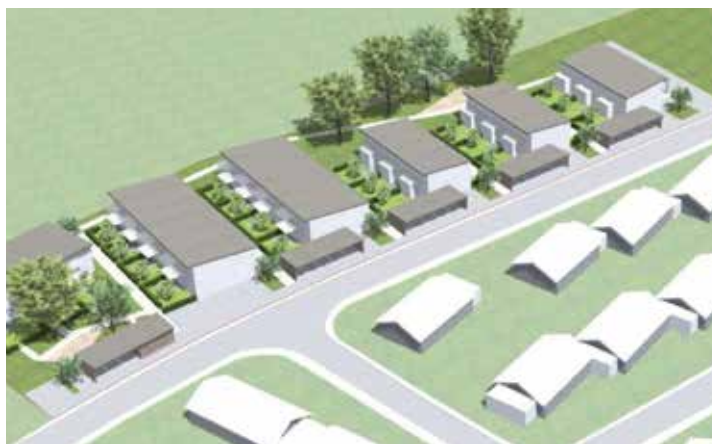
Projet des Grands Bois

Toutes ces habitations seront exemplaires dans leur mise en œuvre.