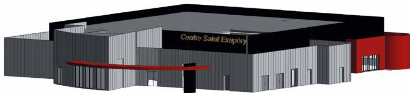
Plan du futur centre Saint-Exupéry - ©Beley Architecte

Depuis 2019, il y a comme un vide au cœur des Champs-Montants. Le Centre Saint-Exupéry et la Halte-Garderie ont brûlé suite à un incendie criminel. Ce lieu symbolique et vivant, au sein duquel des générations d'Audincourtois ont pratiqué un sport, fait leurs devoirs, découvert des tas d'activités, passé des temps de loisirs et de vacances inoubliables, avait disparu. Malgré le déménagement, malgré la continuité du service public dans l'ancien et le nouveau centre Peter Pan, c'est un peu de l'âme du quartier qui avait disparu.