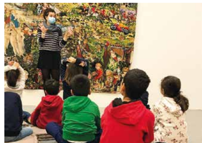
Sortie au CRAC

Page Facebook : MJC-Centre social Saint-Exupéry