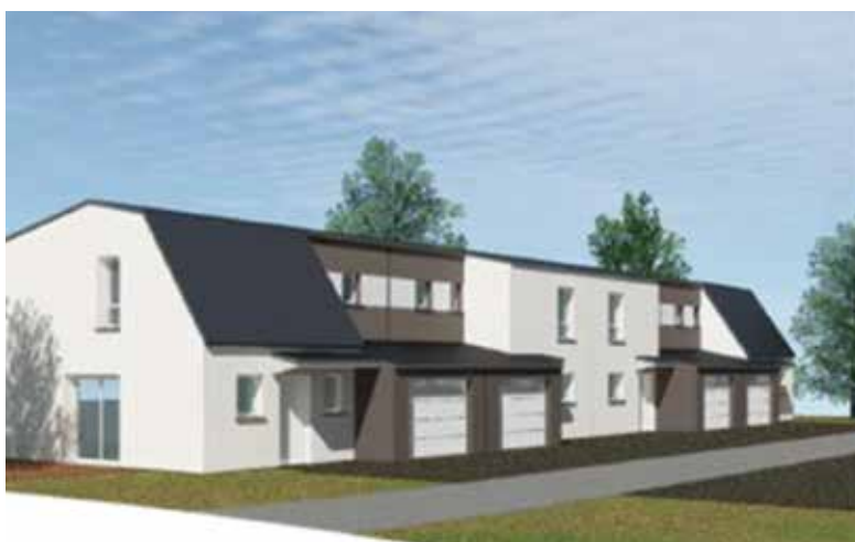
Plan des futurs logements rue des Champs de l'Essart

Tous ces projets seront présentés à la population en réunion de quartier.