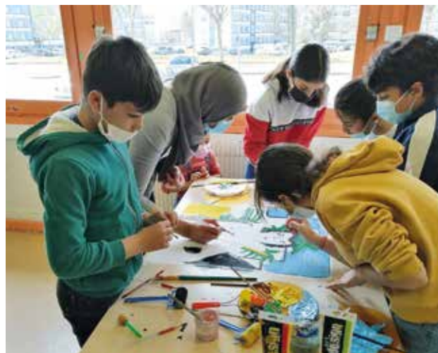
Atelier peinture à la MJC Saint-Exupéry

Toutes les actions menées permettent d'apporter une multitude de sujets à développer auprès des jeunes pour leur