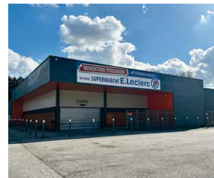
Aux Forges - Ouverture d'un Leclerc à la place du Colruyt

Les conseils de quartier, c'est la ville qui s'écrit avec ses habitants. Des femmes et des hommes qui se rencontrent, échangent, imaginent et agissent. Ici, les idées ne restent pas des intentions : elles deviennent des projets, et les projets deviennent des réalités. Fêtes de quartier, jardins partagés, carnaval, nettoyages des rivières, soutien aux commerces de proximité : autant d'initiatives concrètes qui font vivre les quartiers et renforcent le lien entre celles et ceux qui y habitent. Si vous souhaitez participer, écrivez-nous !