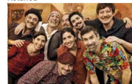
Les ogres de Barback & La Rue Ketanou

Les Ogres de Barback et La Rue Kétanou, amis de longue date, partagent valeurs humanistes et amour de la route. Après une tournée hivernale 2025 et des festivals archi-complets, ils se retrouvent à l'été 2026 pour un ultime tour ensemble, une dernière fête, une évidence.