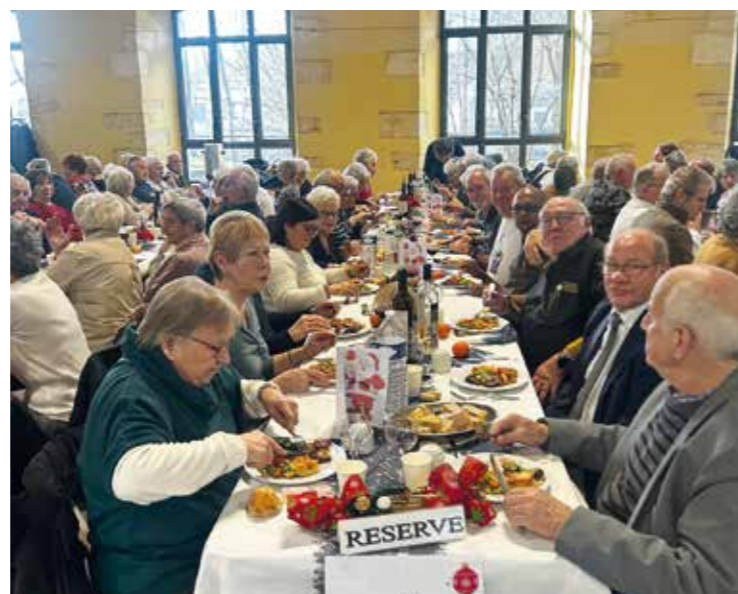
Repas de Noël des seniors

À Audincourt, la solidarité est une responsabilité collective. Elle irrigue toutes nos politiques : soutien aux familles et à la jeunesse, lutte contre le mal-logement, accès à une alimentation saine. Le CCAS en est le pilier, avec des moyens renforcés et un travail étroit avec les acteurs solidaires. La Ville soutient les associations caritatives et met en place une « sécurité sociale alimentaire ». Les seniors sont au cœur des priorités : repas à tarif social, animations, maintien à domicile et lutte contre l'isolement.