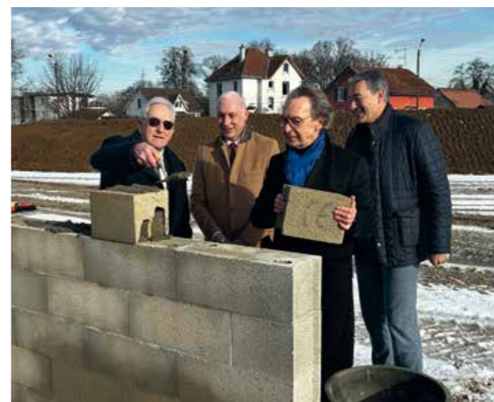
Pose de la 1 ère pierre du projet gare

Création de 114 logements, dont 50 pour les seniors. Un programme inclusif qui répond aux enjeux de densification maîtrisée et de mixité des usages (des logements seniors et des logements familiaux).